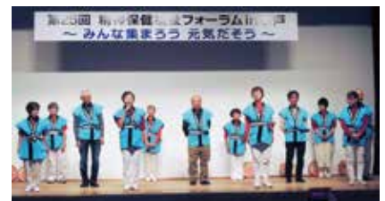
【写真】上：会報紙「ピアかたつむり通信」 下：当事者・家族の集いスナップ

【記事の目次】 1月11日、龍ヶ崎市内の2つの中学校の生徒20名と家族が、龍ヶ崎市立市民会館に集まり、 龍ヶ崎の精神障がい者に対する取り組みについて話し合いました。龍ヶ崎市の精神障がい者に対する取り組みについて話し合いました。龍ヶ崎市の精神障がい者に対する取り組みについて話し合いました。 1月11日、龍ヶ崎市内の2つの中学校の生徒20名と家族が、龍ヶ崎市立市民会館に集まり、 龍ヶ崎の精神障がい者に対する取り組みについて話し合いました。龍ヶ崎市の精神障がい者に対する取り組みについて話し合いました。龍ヶ崎市の精神障がい者に対する取り組みについて話し合いました。 1月11日、龍ヶ崎市内の2つの中学校の生徒20名と家族が、龍ヶ崎市立市民会館に集まり、 龍ヶ崎の精神障がい者に対する取り組みについて話し合いました。龍ヶ崎市の精神障がい者に対する取り組みについて話し合いました。龍ヶ崎市の精神障がい者に対する取り組みについて話し合いました。