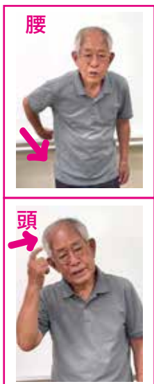
腰や頭など、痛い箇所を指さします。

手話は聴覚に障がいのある方々の大切なコミュニケーション 方法です。日常で使える簡単な手話をご紹介します。