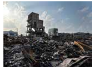
石川県輪島市

この準備金は、災害ボランティアセンターの設置・運営や、被災された方の支援など、災害時にいち早く使えるお金として被災地を支えています。