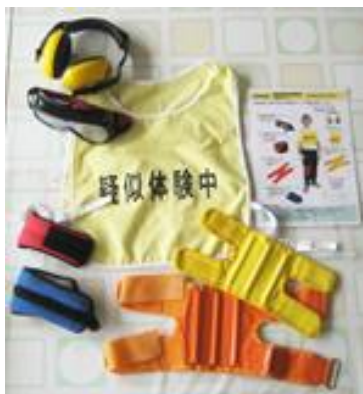
1. 高齢者体験セット